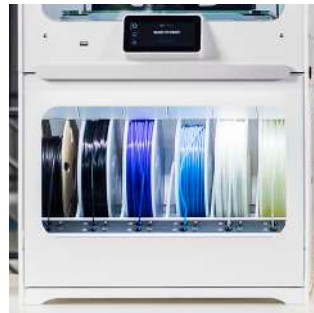
Material Station Simplifier et automatiser la gestion des matériaux