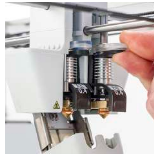
Print cores AA et BB Buses rapidement interchangeables pour matériau de construction et supports solubles