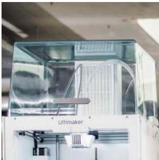
Air Manager Le filtre EPA élimine jusqu'à 95 % des UFP